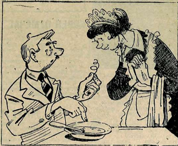
—У вас опять новый повар, курчавый?...