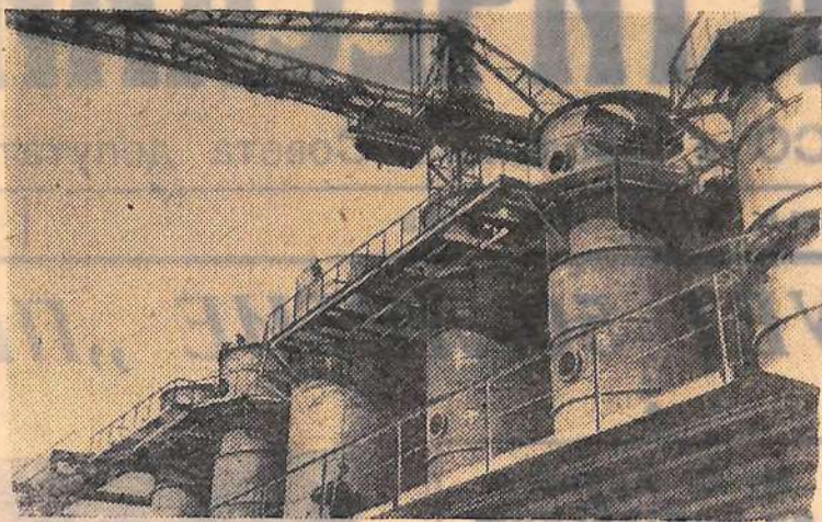
Общий вид одного из цехов комбината искусственного волокна.

Г. САФОНОВА, старшая пионервожатая школы № 52.