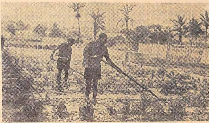
Республика Сенегал. Около 95 процентов населения страны занято в сельском хозяйстве.