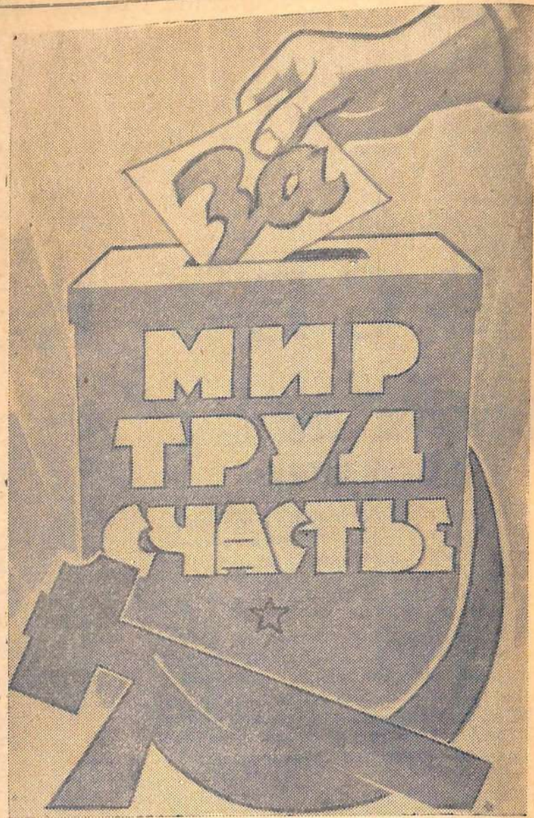
Плакат художника А. Лаврова