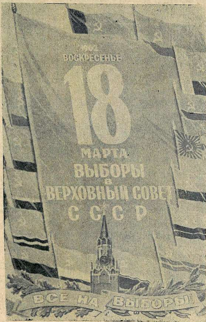
Плакат художника А. Антонченко.

Голосуя сегодня за кандидатов нерушимого блока коммунистов и беспартийных, мы будем голосовать за дальнейший расцвет экономики и культуры нашей страны, за изобилие материальных благ для человека, за светлое будущее — коммунизм.