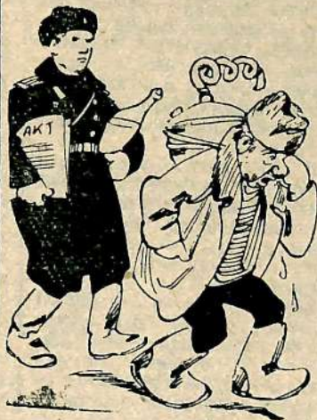
—Бы-ва-а-ли дни в сел... Рис. Ю. Узбякова.