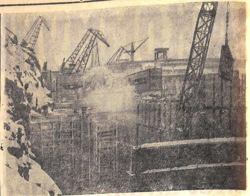
Четырехкамерный шлюз — ударный участок строительства Бухтарминского гидроузла. Здесь уже завершена выемка скального грунта, илет укладка бетона, монтируются оборудование, трубопроводы, закладные части и щиты. Бетонные работы в шлюзе ведутся новым, прогрессивным методом. Вместо опалубки устанавливаются стены из сборных бетонных панелей. Это ускоряет строительство, удешевляет его стоимость. В сентябре 1962 года шлюз пропустит первые речные корабли. На снимке: вид на строительство шлюза.

Н. СЕСКУТОВ, старший инженер бюро технической информации завода имени Ф. Э. Дзержинского.