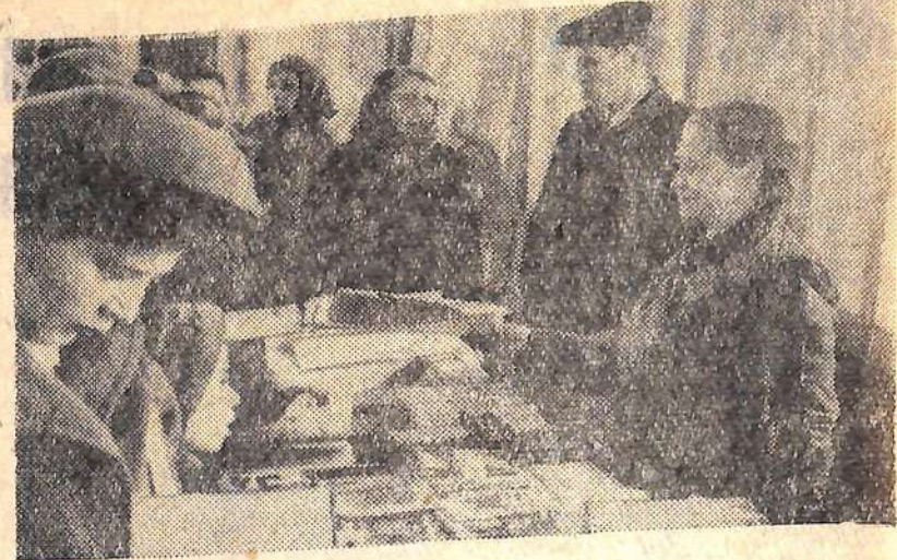
В открытом недавно новом универсаме горторга работает киоск продажи литературы, привлекающий много покупателей.