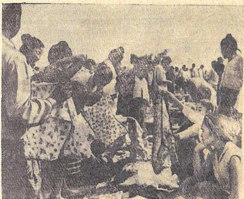
Лаос. На базаре в Сиенг-Куанге.