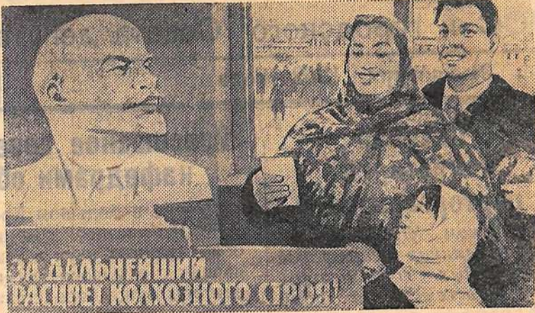
Плакат художника Э. Арцруняна (ИЗОГИЗ).

А. МОСОЛОВ, заместитель секретаря парторганизации горторга.