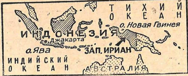
Карта Индонезии и Западного Ириана. Художник А. Ведерников.