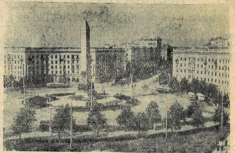
Минск. Круглая площадь.

№ 10 (5125) Вторник, 16 января 1962 года | Цена 2 коп.