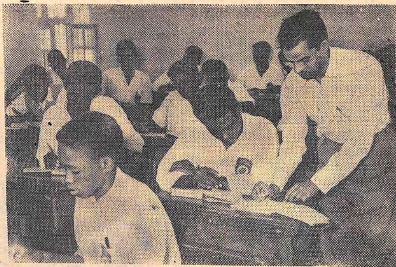
Судан. Город Омдурман. В колледже.

Многочисленные прогрессивные организации Панамы заявили энергичный протест в связи с действиями властей и поддержали позицию, занятую индейцами племени Кунас. (ТАСС).