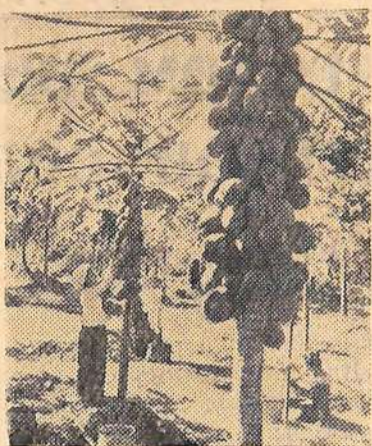
Китайская Народная Республика. На плантации папайи (лынное дерево) в провинции Юньнань.