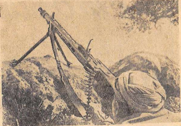
Восьмой год сражаются мужественные воины Алжирской Национально-освободительной армии против французских колонизаторов. Бойцы неустанно повышают свое военное мастерство. На снимке: солдат Национально-освободительной армии на учениях.

С января начавшегося года в Ленинграде начнется серийный выпуск двенадцатиканальных телевизоров «Смена». Это одна из первых моделей телевизионного приемника третьего класса, которая выполнена методом печатного монтажа и изготавливается механизированным и автоматизированным путем. В схеме телевизора 14 радиоламп и восемь полупроводниковых приборов.