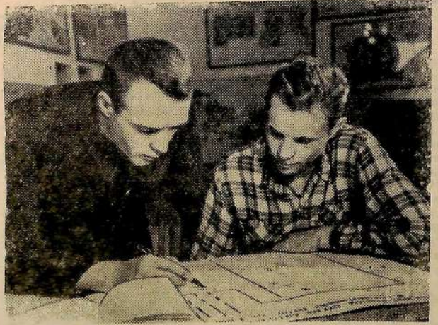
ны также школы повышения квалификации, передового опыта. Каждый четвертый в коллективе имеет среднее или высшее образование, такое же количество людей учится в школе рабочей молодежи, в техникумах и институтах. Уже сейчас рабочие привлечены к управлению производством. Коллектив сам решает вопросы найма и увольнения.

Новая техника и механизмы потребуют от людей высокого уровня знаний. Вот почему большое внимание уделено подготовке кадров завтрашнего дня. При депо организован комбинат производственного-технического обучения, где каждый машинист и подвёж каждый овладевает искусством управления паровозом, тепловозом и электровозом. Созда-