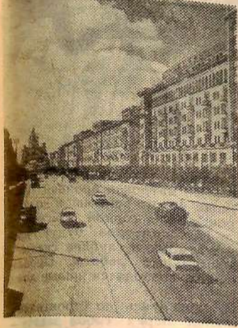
Москва. На Большой Садовой

Особенно ценным растением является грецкий орех, который дает до 73 процентов выхода масла. Это „универсальное“ дерево, и его плоды находят разнообразное применение.