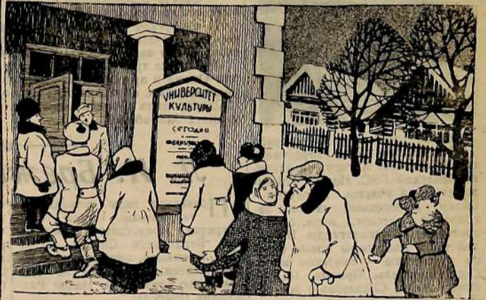
Студенты народного университета.