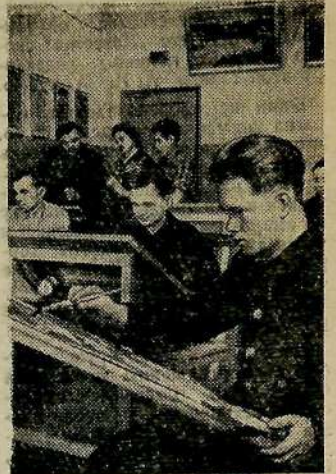
Четвертый год работает студия при Дворце культуры железнодорожников станции Брянск II. В ней занимаются 22 человека — работники железнодорожного транспорта, дети железнодорожников. За последние два года были организованы четыре выставки работ студийцев.

— Молодец! — хором поздравили мы победителя и вместе подошли к нему, пожимая по очереди крепкую ладошку юного товарища. А. КАЛАБУХОВ.