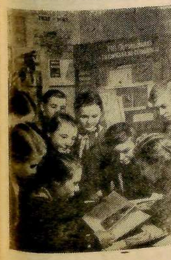
22 декабря исполняется 25 лет со дня смерти выдающегося советского писателя Н. А. Островского. Много экспонатов, рассказывающих о жизни Н. А. Островского, собрано в библиотеке-музее на родине писателя — в селе Вилия, Острогожского района, Пензенской области.