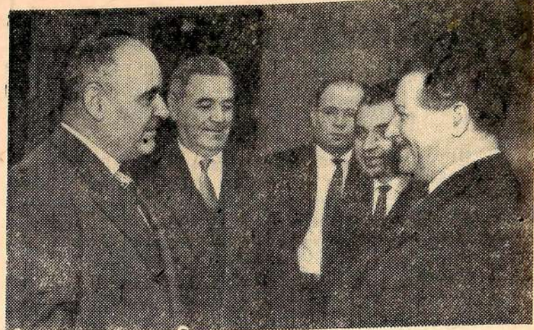
Первый секретарь ЦК Румынской рабочей партии Г. Георгиу-Деж беседует на XXII съезде КПСС с членом Политбюро ЦК Болгарской коммунистической партии А. Юговым.

Большим радостным праздником достижений советской науки и культуры является юбилей.