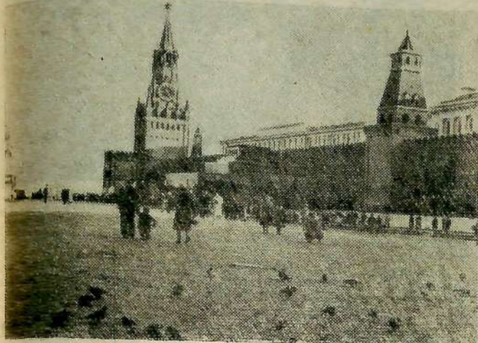
Москва. Красная площадь.