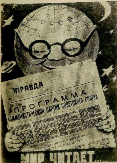
Плакат художника Б. Антонова.

Московский городской совнархоз выпустил оригинальный сувенир — настольный портсигар с музыкой. Выполненный из анодированного металла, он устанавливается вертикально на пластмассовом основании. Когда нажимаешь кнопку, крышка портсигара откидывается, включается механизм — и звучит мелодия „Подмосковные вечера“.