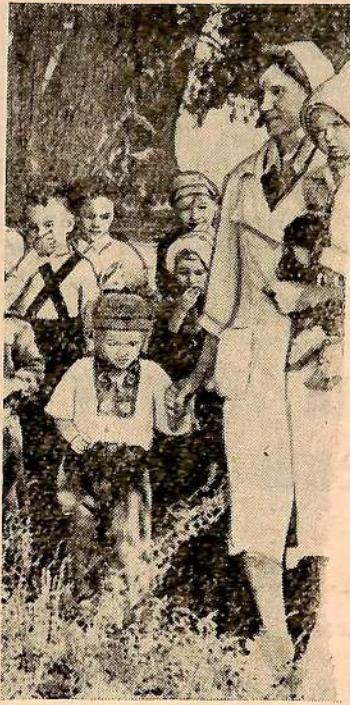
В колхозных детских садах.