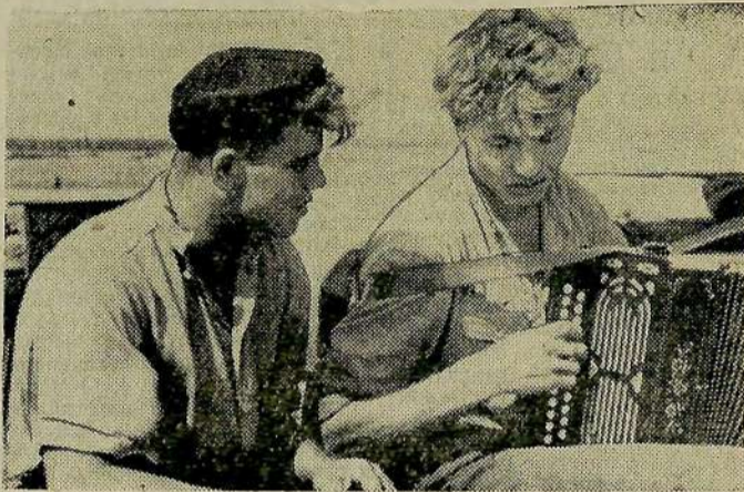
В часы досуга на полевом стане.