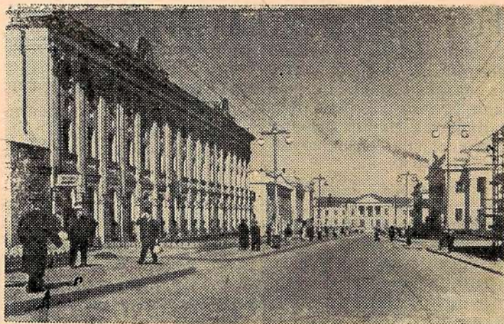
Воркута. Московская улица.

Республика стала крупным топливно-энергетическим и лесопро-