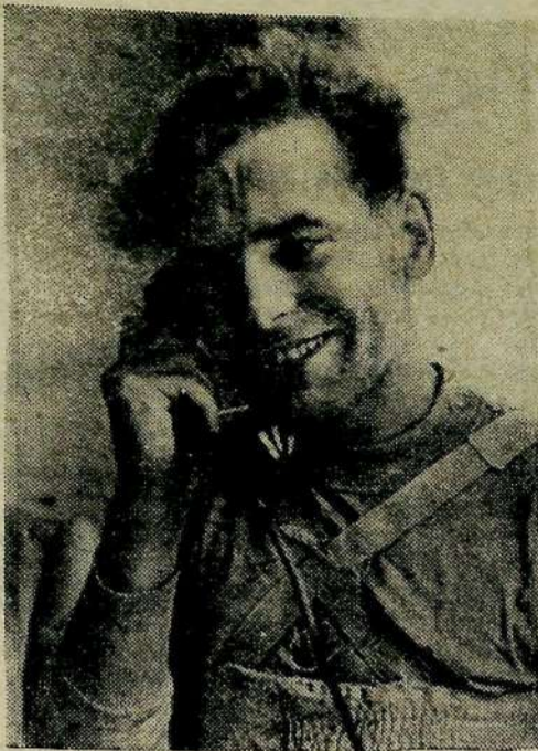
Летчик-космонавт майор Герман Степанович Титов на тренировке перед полетом в космос.