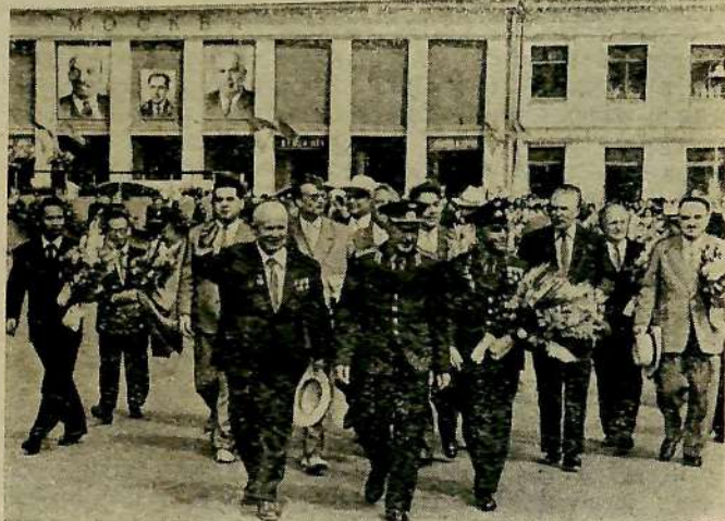
Торжественная встреча на Внуковском аэродроме славного сына советского народа героя-космонавта майора Германа Степановича Титова.