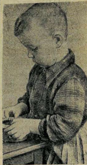
Трудная задача.

Своим полетом Мир потряс Любимый наш Товарищ Герман. Радиограмму Шлет Гагарин: Тебе, дружище, Благодарен! До скорой встречи На Земле! Увидимся В родном Кремле! Мне не найти Теплее слова, Хоть весь словарь Развороши. Героя-летчика Титова Я поздравляю От души!