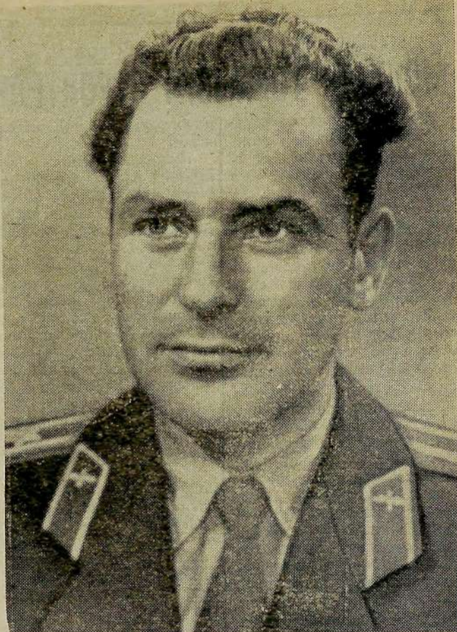
6 августа 1961 года в 9 часов московского времени в Советском Союзе произведен новый запуск на орбиту спутника Земли космического корабля „Восток-2“. Корабль „Восток-2“ пилотируется гражданином Советского Союза летчиком-космонавтом майором товарищем Титовым Германом Степановичем. На снимке: летчик-космонавт майор Герман Степанович Титов.