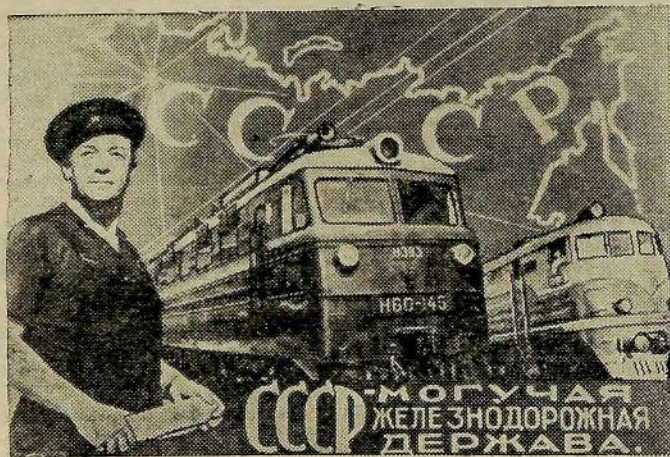
Фотомонтаж Б. Антонова.

В. КИСЛЮК, главный диспетчер управления железнодорожного транспорта.