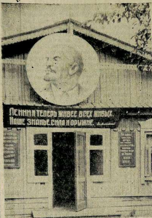
Пионерский лагерь машиностроительного завода имени Ф. Э. Дзержинского.

они работали в поле, ухаживали за картофелем. И это им очень нравилось. Возвращаясь с поля, они пели: