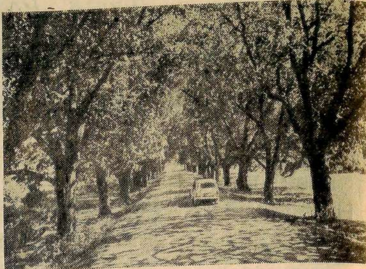
Живописная автострада Нуха—Кахи—Закаталы (Азербайджанская ССР). Десятки километров ее проходят среди ореховых рощ.