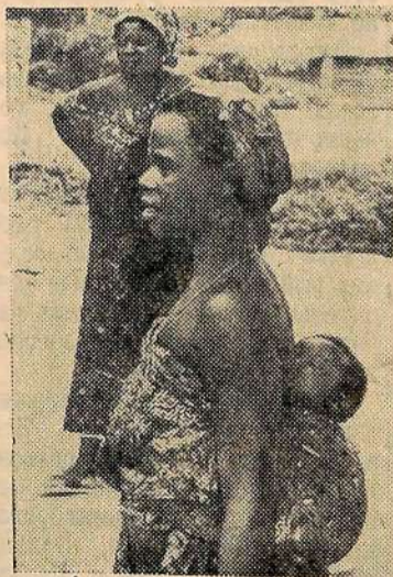
Республика Гана. Так во многих странах Африки матери носят своих детей.

В другой парламентской резолюции группа лейбористов, возглавляемая Сиднеем Силверманом, подчеркивает отсутствие разумных причин для дальнейшего отката от признания Германской Демократической Республики. Лейбористы призывают английское правительство проявить инициативу с тем, чтобы положить конец нынешнему ненормальному статусу Западного Берлина.