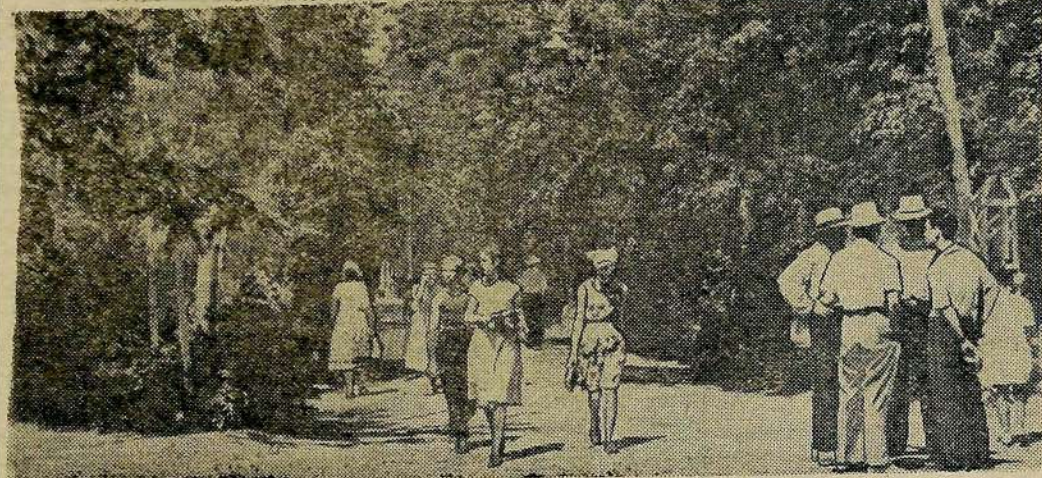
В парке судоремонтного завода.