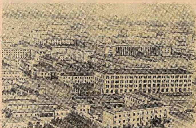
Столица Народной Республики Монголии Улан-Батор. (Вид с вертолета).