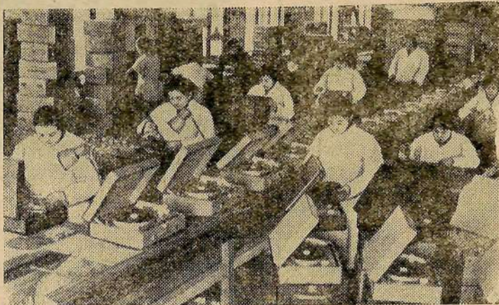
На шанхайском патефонном заводе освоен выпуск новых четырехскоростных электропроигрывателей. Для их производства на заводе построена поточная линия.

На снимке: сборка электропроигрывателей в цехе завода.