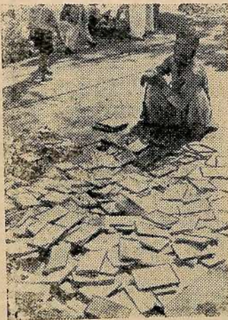
Продавец книг на улицах Дели.