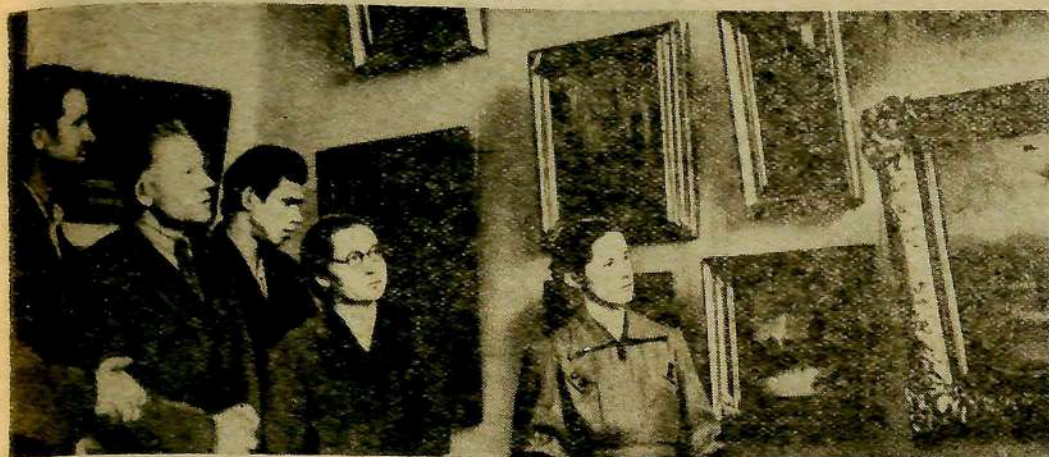
Группа членов кружка изобразительного искусства районного Дома культуры побывала в городе Саратове, где они посетили музей Радищева, познакомились с картинами известных художников.