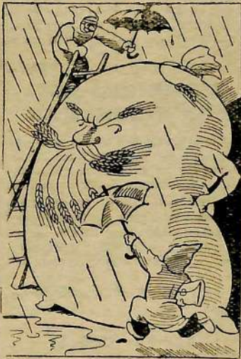
Так наши хлебозаготовители «встречают» урожай... Рис. А. Зубова.

А. ФИЛИППОВА, заведующая отделом редакции.