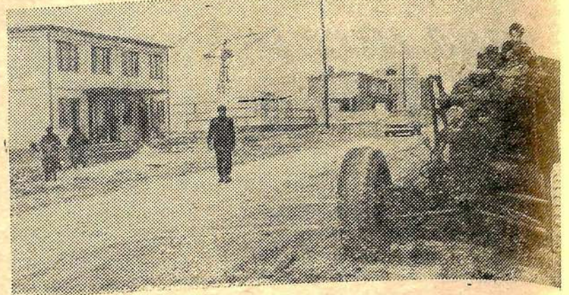
На одной из новых улиц жилого городка совхоза «Волма» Белорусской ССР.

Пленум принял решение, направленное на успешное выполнение обязательств.