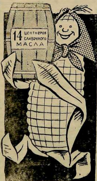
—На одном гектаре я Это Вам произвела! Рис. В. Персона.

(Из речи тов. Хрущева на совещании передовиков сельского хозяйства республики Закавказья 4 февраля 1961 г.)