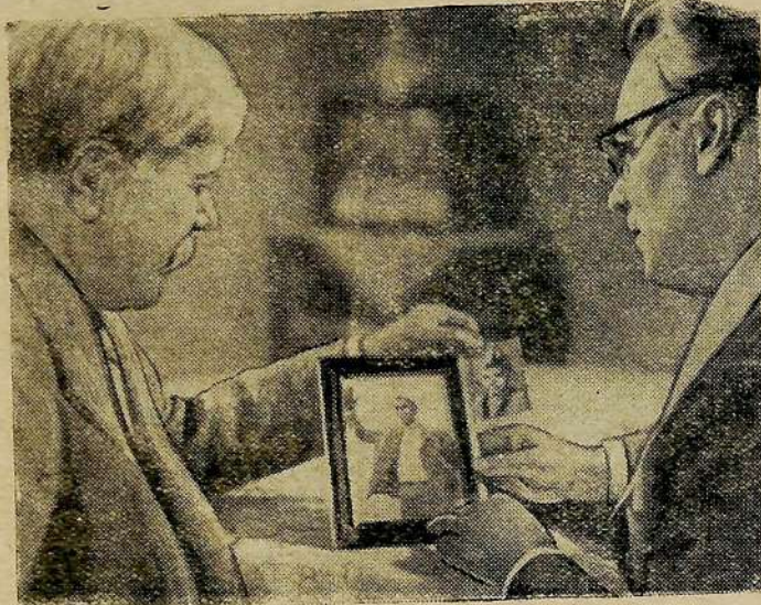
Кадр из кинофильма «Наследники».