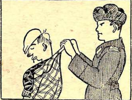
Жди больших неприятностей.