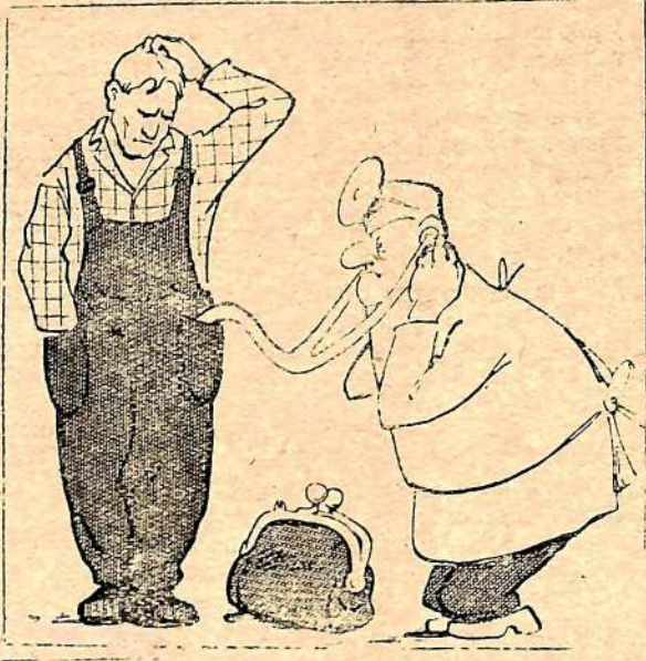
Рис. А. Грунина.