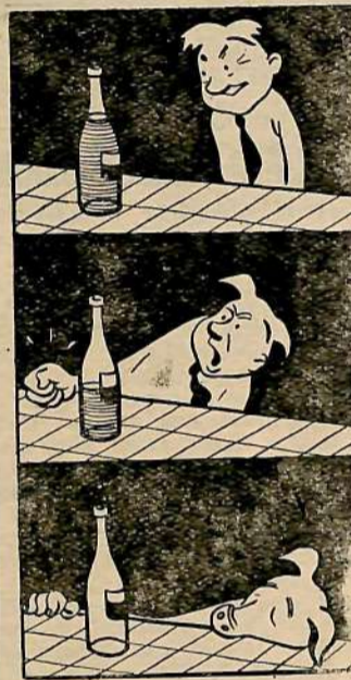
За столом в кафе орса Саратовгэстроя. Рис. А. Цветкова.