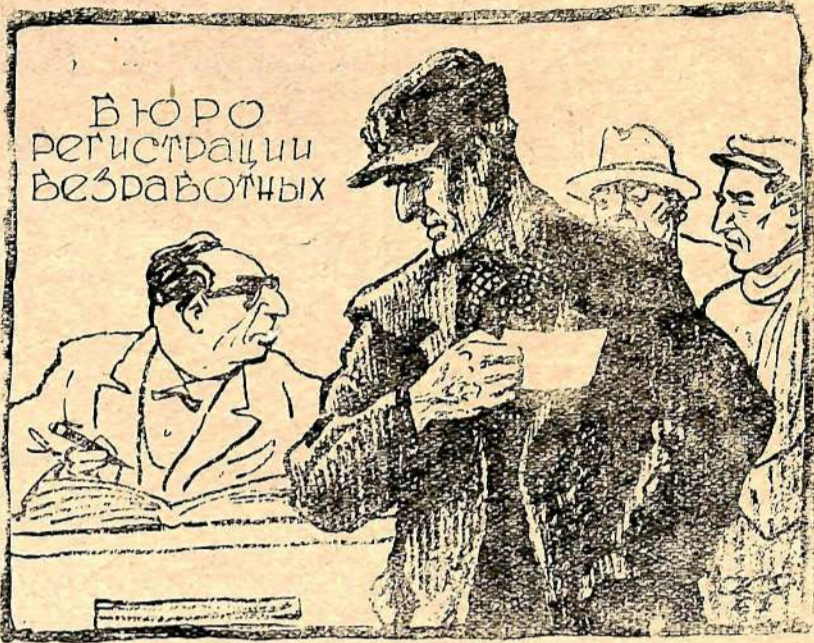
—Ну, этому-то чиновнику безработица не угрожает! Рис. К. Елисеева.

В США количество безработных превышает 5,5 миллиона человек.