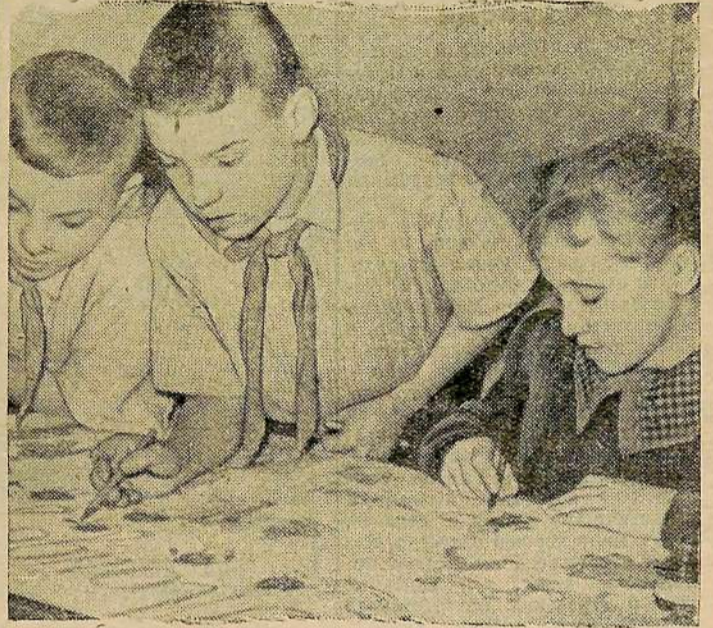
Большой популярностью среди учащихся Аткарской школы-интерната пользуется сатирическая газета „Мойдодыр“. На снимке: члены редколлегии за выпуском очередного номера „Мойдодыра“.