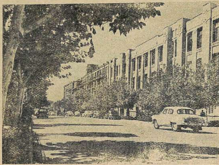
Ереван. Улица Шаумяна.