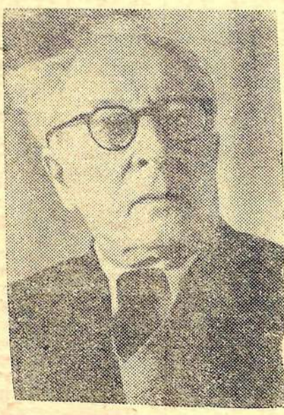
5. Амосову Николаю Михайловичу, доктору медицинских наук,—за разработку и внедрение в широкую медицинскую практику оригинальных методов хирургического лечения заболеваний легких.