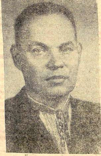
3. Твардовскому Александру Трифоновичу—за поэму «За далью даль».