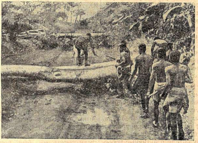
Северная часть португальской колонии Анголы охвачена восстанием. Несколько тысяч повстанцев участвовали в выступлениях против сил колонизаторов. На снимке: заграждения, устроенные повстанцами.

Я надеюсь, заявил он, что заинтересованные стороны положительно ответят на этот призыв. В эти дни решается судьба Лаоса. Если все лаосянцы проявят добрую волю, вопрос о национальном согласии будет решен, исходя из высших интересов нашей родины. (ТАСС).