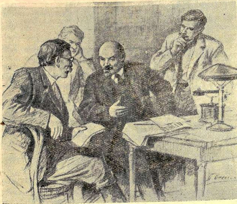
В. И. Ленин беседует с рабочими корреспондентами в редакции газеты «Правда».