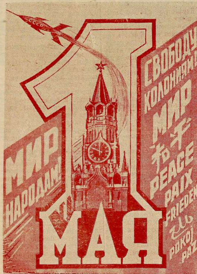
Фотоплакат Б. Антонова.