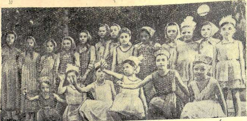
Много веселых танцев разучили ребята, занимающиеся в детском секторе художественной самодеятельности клуба завода имени Ф. Э. Дзержинского.