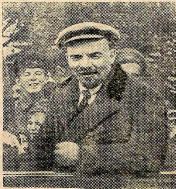
В. И. Ленин у рабочих Рублевской водокачки. 1 мая 1919 года (кинокадр). (Из альбома, подготовляемого к выпуску Институтом марксизма-ленинизма при ЦК КПСС).