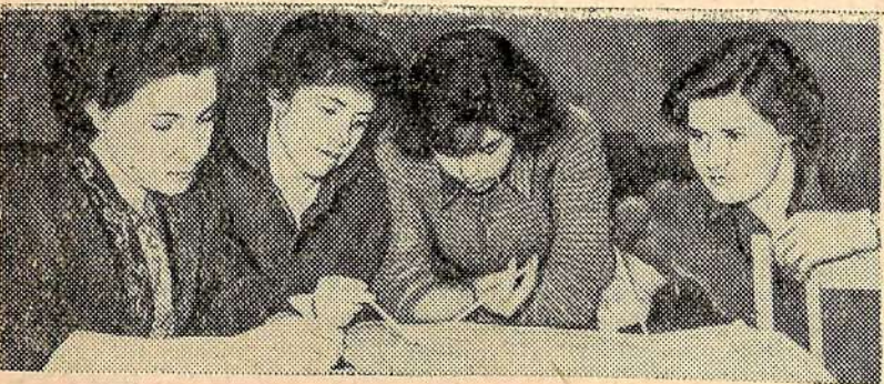
Девушки второго общежития Саратовгэстроя за оформлением наглядной агитации.