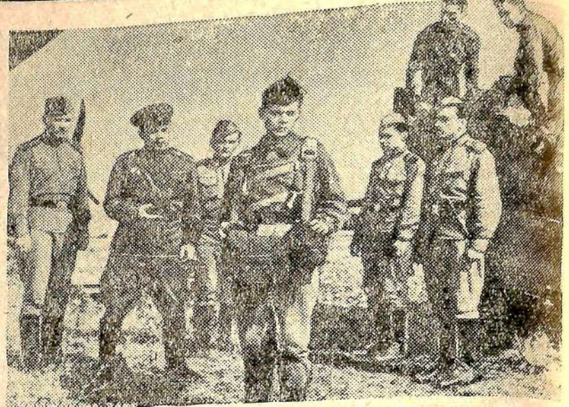
Кадр из новой кинокартины „Прыжок на заре“ производства киностудии имени М. Горького. Фильм поставлен режиссером И. Лукинским по сценарию Г. Березко.

Участники совещания призвали всех кукурузоводов страны бороться за получение в среднем по 500 центнеров зеленой массы и по 50 центнеров зерна кукурузы с гектара. (ТАСС).