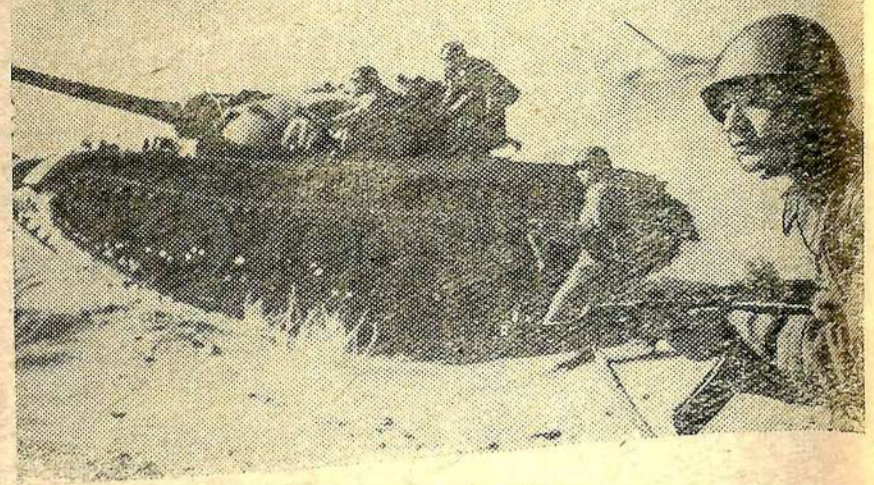
В Н-ской части на тактических занятиях.

Вооруженные Силы СССР готовы в любой момент защитить мирный, созидательный труд советского народа, успешно строящего коммунизм.