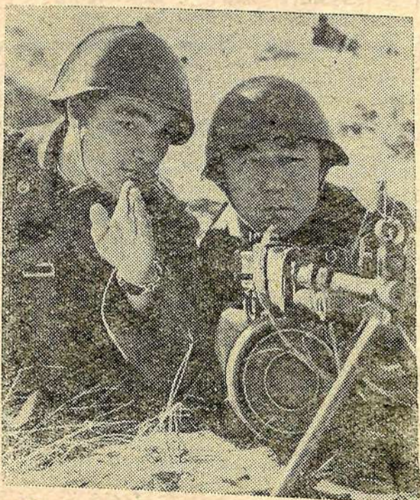
В Н-ской части на тактических занятиях.