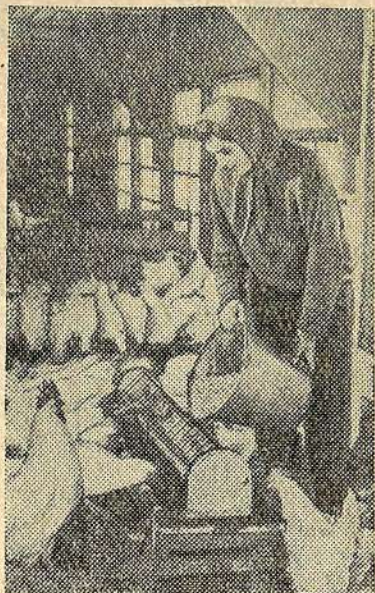
Чехословацкая Социалистическая Республика. На птицеферме государственного хозяйства Иглава.

В сообщении указывается далее, что в эти дни Стэнливилль—временная резиденция законного конголезского правительства—находится в глубоком трауре.