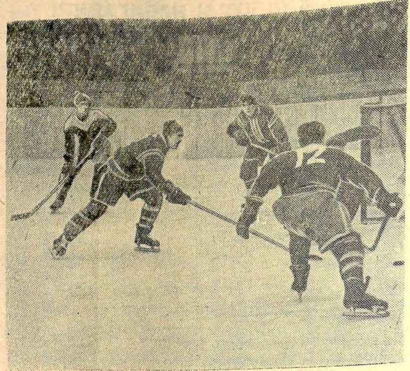
В декабре прошлого года на катке Саратовского Дворца культуры проходили игры в хоккей на первенство Российской Федерации. На снимке: атака у ворот команды города Раменского. Наступают хоккеисты спортивного общества «Авангард».