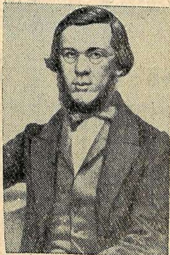
литературно-критические статьи Н. А. Добролюбова развивали

лучшие традиции русской эстетики, двигали вперед научную мысль, прокладывая новые пути русской литературы.